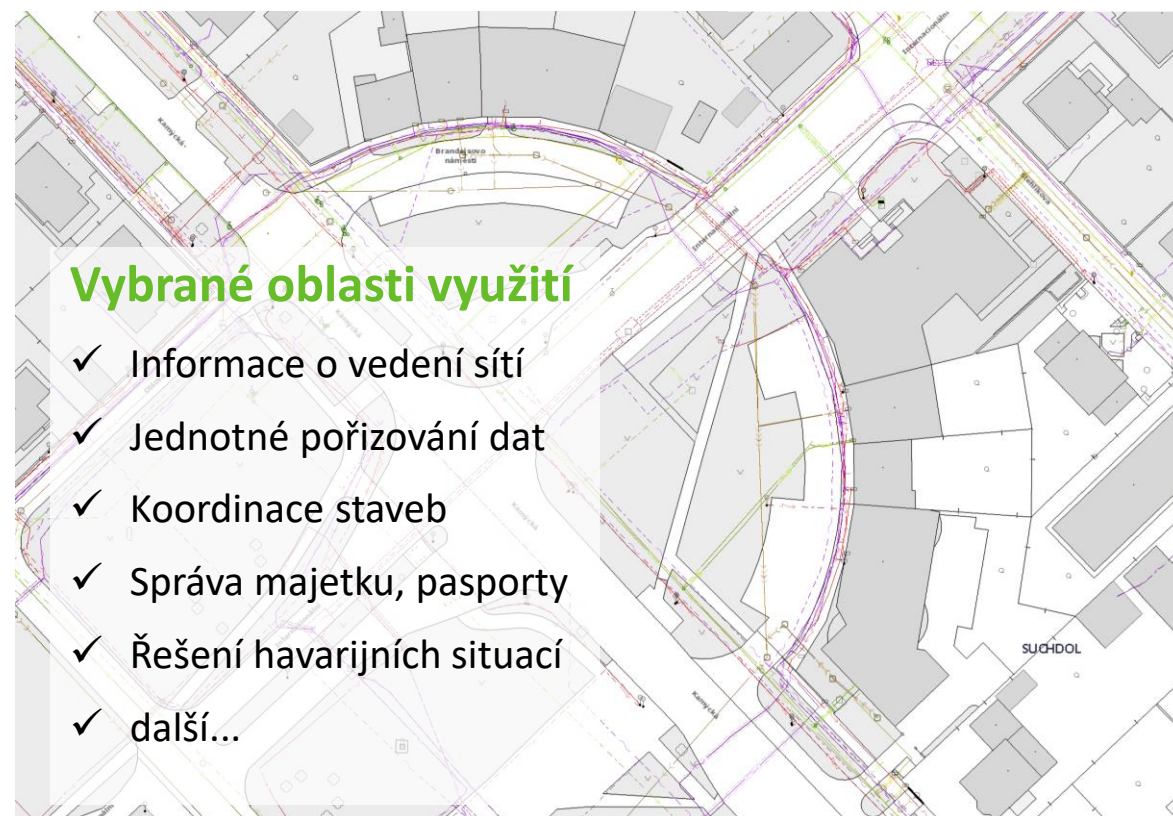
Ukázka DTM Prahy